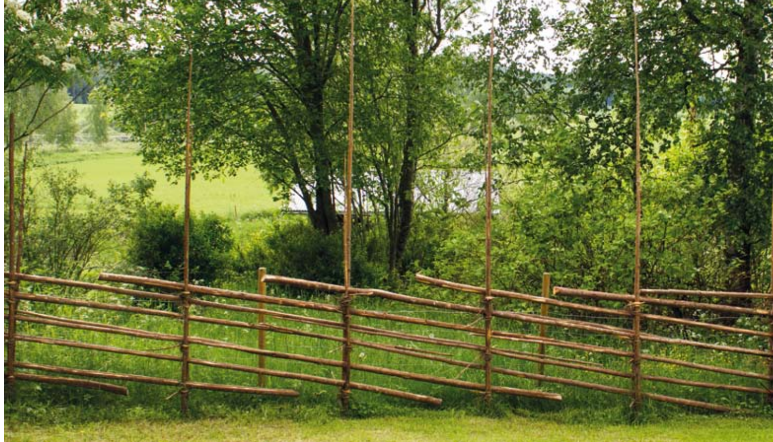
Perinteisen riukuaidan tai pisteaidan teko on taito, jota moni ei enää hallitse. Aidan rakentaminen vaatii tuntemusta sopivista materiaaleista ja perinteisestä rakennustavasta, jossa mm. käytetään kuusennäreitä riukujen sidontaan.

On muistettava, että kosteikkojen perustamis- ja hoitotoimenpiteet vaativat hyvät suunnitelmat ja luvat.