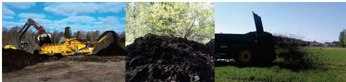
Kuva 1. Hautomokuoren käsittelyä.

Hautomokuori oli luomukelpoista vaneritehtaan kuusitukkien hautomoltaista saatavaa kuori- ja maa-ainesta sisältävää materiaalia. Aines kuivatettiin (ka keskimäärin 40 %), lajiteltiin ja murskattiin. Se oli levitettävissä pohjatuhkan ja kuonakalkin tavoin kuivalannan levityslaitteella (kuva 1).